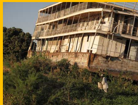
Steamer anglais échoué, Karima, Soudan