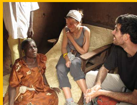
6 300 km vers la Méditerranée